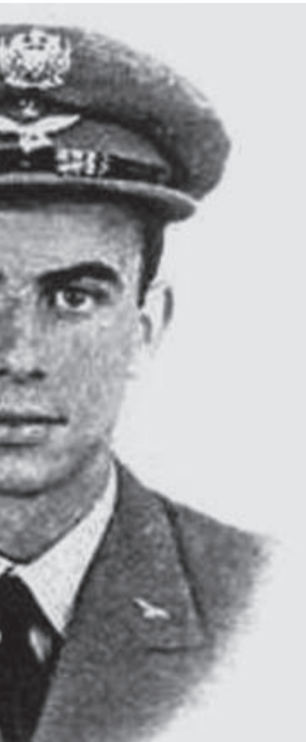
mpriu serviço militar na Guiné-Bissau

↘ A exposição infográfica "Cinco décadas de democracia, o que mudou?" encontra-se patente na praça 8 de Maio, até 4 de agosto. A mostra, promovida pela Fundação Francisco Manuel dos Santos para assinalar os 50 anos do 25 de Abril, reúne infografias com dados da Pordata que ilustram a evolução do país.