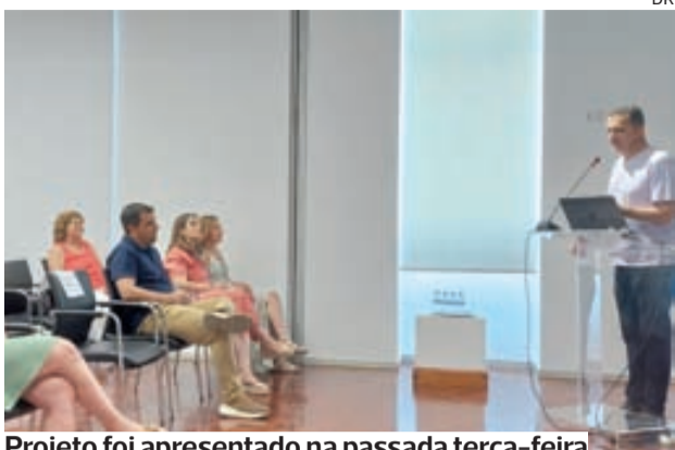
Projeto foi apresentado na passada terça-feira