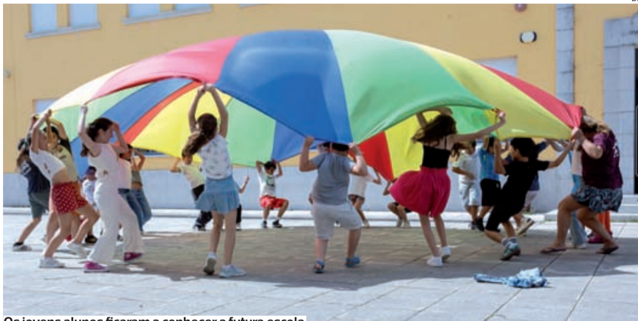
Os jovens alunos ficaram a conhecer a futura escola

●●● O Município de Condeixa-a-Nova, em articulação com o Agrupamento de Escolas de Condeixa, promoveu, recentemente, a iniciativa “A minha nova escola”, dirigida aos alunos finalistas do 1.º ciclo, com o objetivo de apoiar a transição dos alunos do 4.º para o 5.º ano de escolaridade.