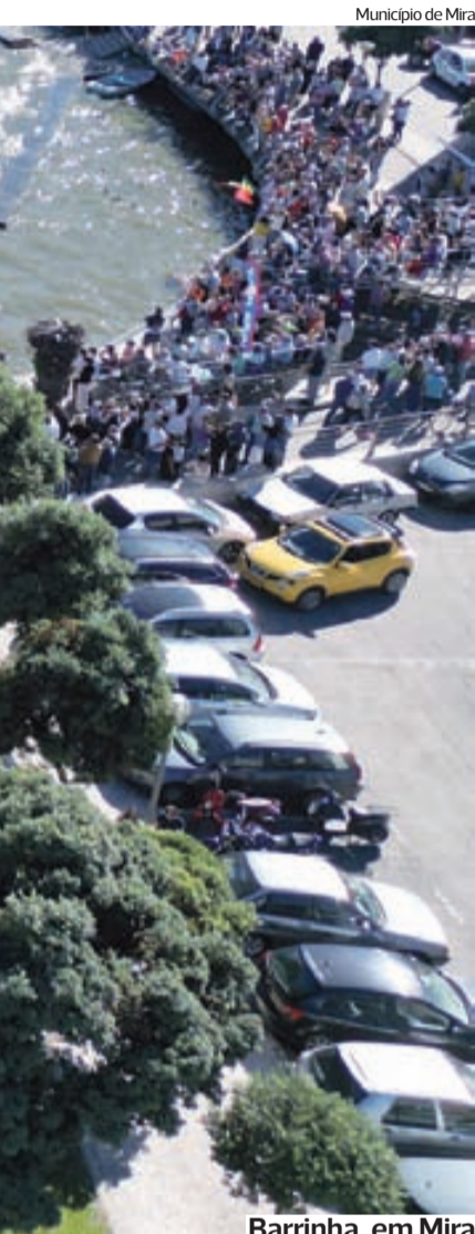
Município de Mira

↘ A PUMA é a nova fornecedora oficial dos equipamentos da Académica/OAF, revelou ontem o clube conimbricense através das redes sociais. A partir da presente época (2025/2026) a marca alemã de equipamentos desportivos irá vestir os estudantes. A PUMA sucede-se à Adidas, que equipou a Briosa na época anterior.