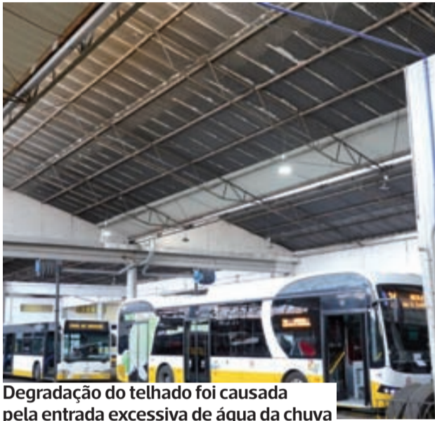
Degradação do telhado foi causada pela entrada excessiva de água da chuva

Os Serviços Municipalizados de Transportes Urbanos de Coimbra (SMTUC) concluíram uma empreitada de substituição de caleiras e de chapas metálicas no telhado da sua oficina. Esta intervenção, com um investimento de 45.380,39 euros, teve como objetivo melhorar as condições de trabalho dos colaboradores e mitigar eventuais danos por infiltração de água nos períodos de maior pluviosidade.