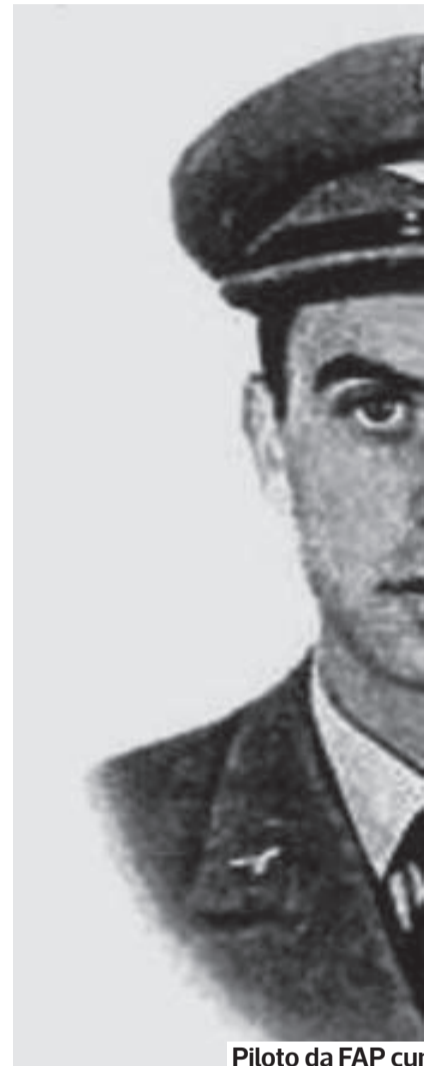
Piloto da FAP cur