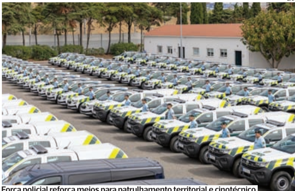
Força policial reforça meios para patrulhamento territorial e cinotécnico

Cerimónia decorreu ontem na Escola da Guarda, em Queluz. Estiveram presentes diversas altas entidades militares e civis