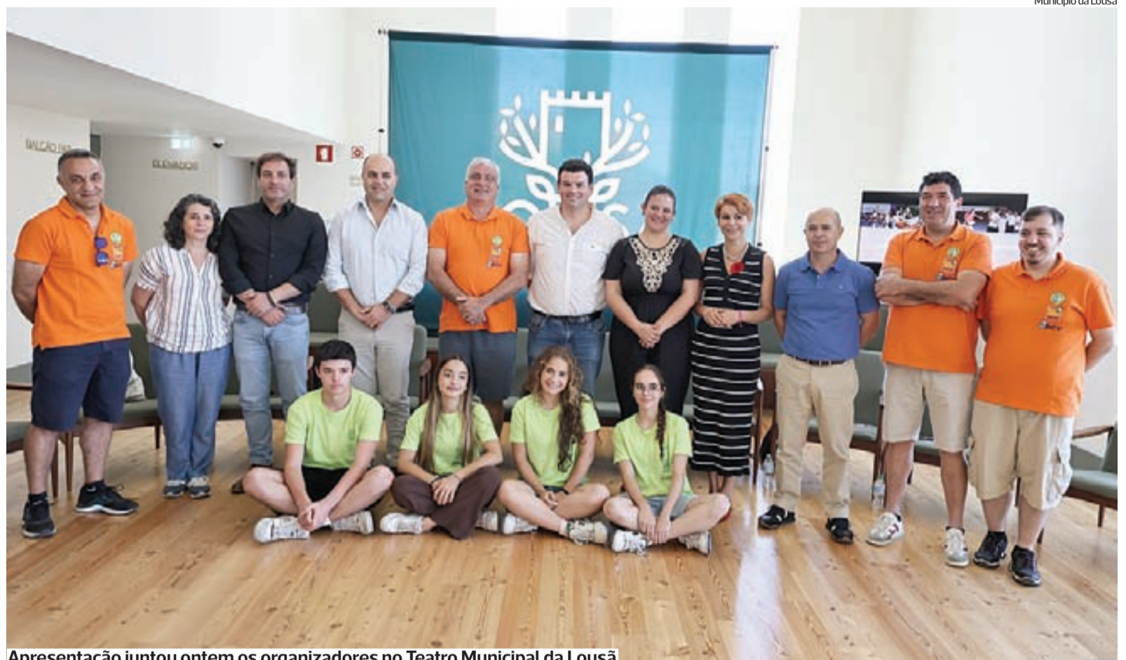
Município da Lousã