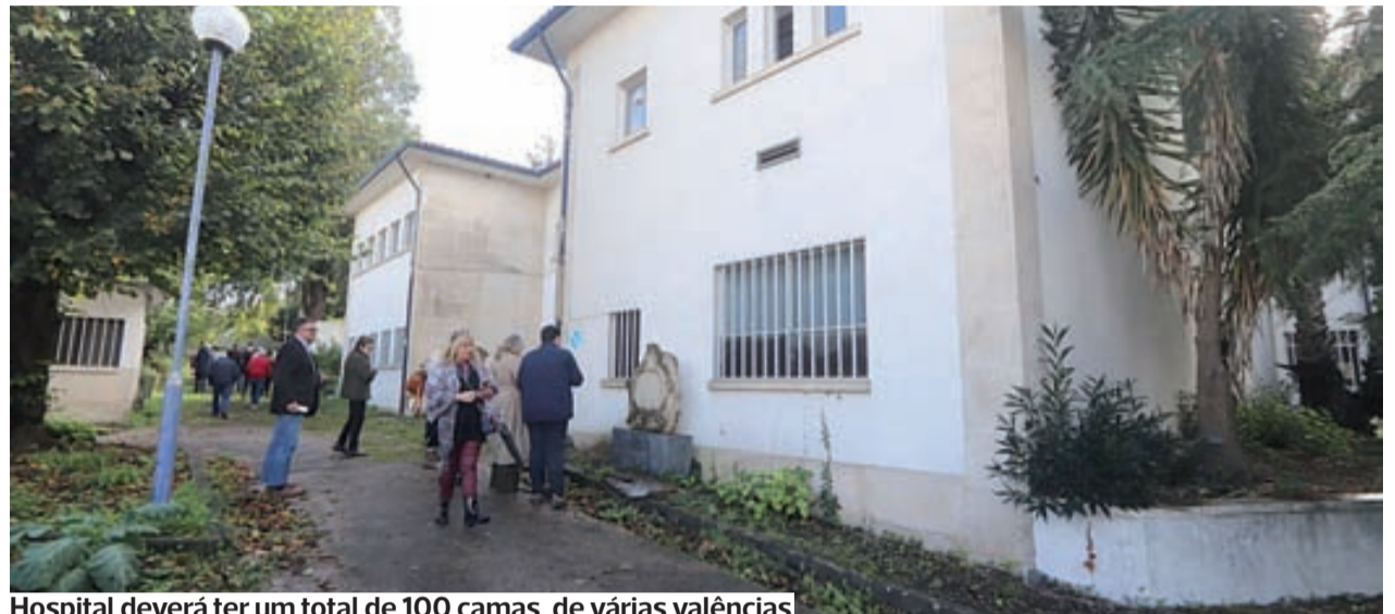
Hospital deverá ter um total de 100 camas, de várias valências