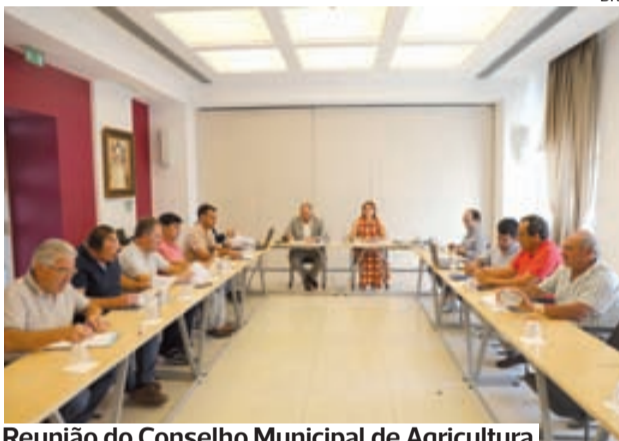
Reunião do Conselho Municipal de Agricultura

●●● A primeira reunião do Conselho Municipal de Agricultura de Cantanhede realizou-se esta quinta-feira, 3 de julho, com o objetivo de reforçar a articulação entre o município e os principais agentes do setor agrícola local.