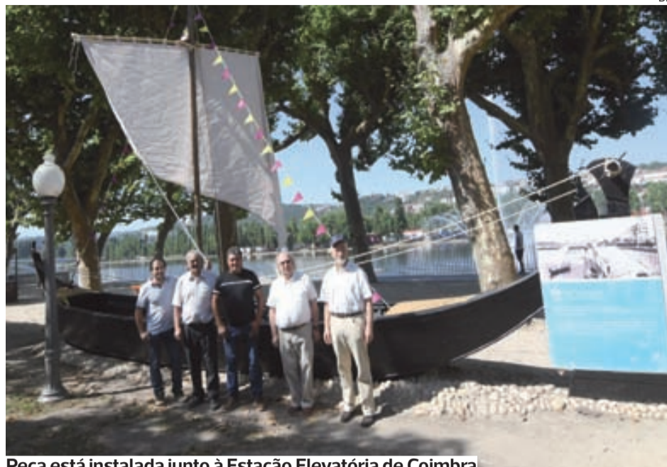
Peça está instalada junto à Estação Elevatória de Coimbra

O projeto Ler Teatro com Ciência pretende dar a conhecer dramaturgias com conteúdos relacionados com ciência, sob a forma de sessões públicas de leitura de peças contemporâneas.