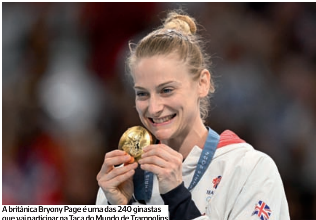
A britânica Bryony Page é uma das 240 ginastas que vai participar na Taça do Mundo de Trampolins

●●● Bryony Page, vencedora da medalha de ouro nos últimos Jogos Olímpicos de Paris em trampolim, vai competir este fim de semana na Taça do Mundo de Trampolins, que decorre no Pavilhão Mário Mexia, em Coimbra.