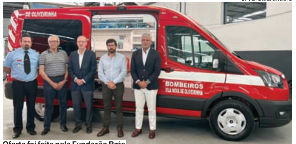
Oferta foi feita pela Fundação Brás

Com alerta pelas 14H12, estiveram no teatro das operações 54 operacionais, apoiados por 11 viaturas e três meios aéreos. |I.M.